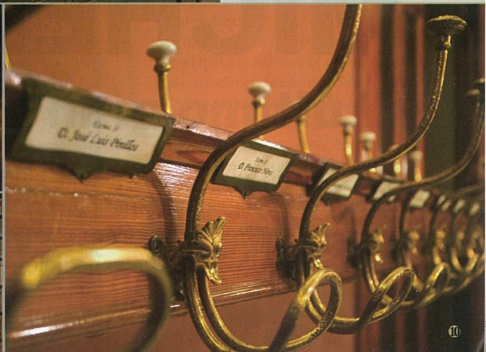
1. El interior de la Real Academia tiene un aire detenido en el tiempo en aquella mañana de su inauguración, en 1894. 2. La Sala Dámaso Alonso, que alberga su biblioteca y legajos. 3. Los ficheros con los diez millones de papeletas con las anotaciones sobre las palabras que se utilizaron para confeccionar el Diccionario. 4. El salón de actos donde se realizan las ceremonias más solemnes. 5. La biblioteca conserva primeras ediciones de valor incalculable. 6. El fichero de revistas, de las que la RAE tiene también una extraordinaria colección. 7. Una mirada desde la primera planta. 8. Los célebres sillones con las letras correspondientes para cada académico. 9. Un detalle de la biblioteca. 10. El perchero, que marca la veteranía de sus usuarios.