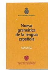
Manual de la nueva gramática de la lengua española RAE Espasa 350 págs. 24,90 €.

El siguiente paso es visitar el búnquer, la sala de cartas del galeón: la habitación de plenos, con la gran mesa ovalada donde están las 44 sillas con las letras mayúsculas y minúsculas donde se reúnen los académicos para decidir cómo han de ser las piezas de precisión que mueven la relojería del idioma. La sala resulta algo claustrofóbica, iluminada únicamente con una diadema de luz que baja sobre la mesa a muy poca altura y que deja el resto del espacio en tinieblas. Resulta sorprendente que quienes han de hacer brillar el idioma con las luces de la