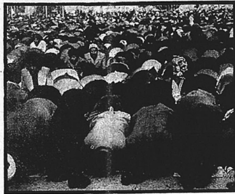
«Allah illah Allah, ua Muhammad rasul Allah.» En la Universidad de Teherán, la multitud, descalza y vuelta hacia La Meca, se inclina una de las «raka'hat» de la plegaria islámica. Con fervor los iraníes piden a Dios que el sha Reza Pahlevi les sea entregado para que purgue sus crímenes y que el siglo XV, que ahora comienza, depara al pueblo salud y prosperidad. «... No hay otro Dios que Dios, y Jomeini es su profeta.»

Esta caída en picado del prestigio USA en el Oriente Medio, por otra parte, está siendo origen de una creciente inquietud en el único país cuya única garantía de supervivencia reside en los Estados Unidos: Israel. La manifiesta debilidad USA y el peligro de una ofensiva islámica contra Occidente en el nombre de Alá está quitando el sueño en los últimos días a