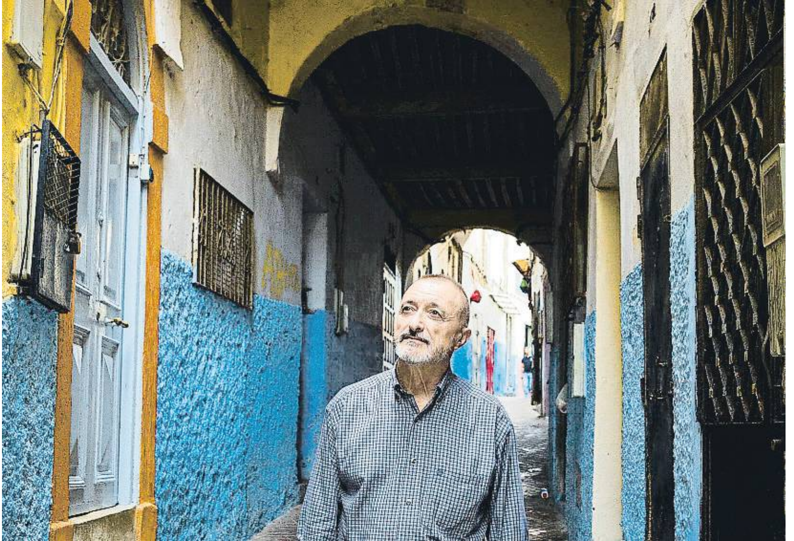
Arturo Pérez-Reverte fotografiat a la medina de Tànger